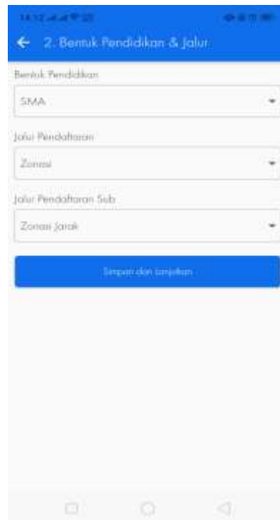
Gambar 3.5. Halaman Bentuk Pendidikan & Jalur