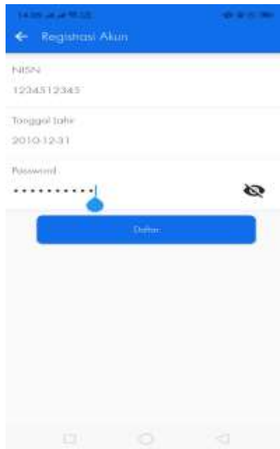
Gambar 3.1. Halaman Registrasi Akun