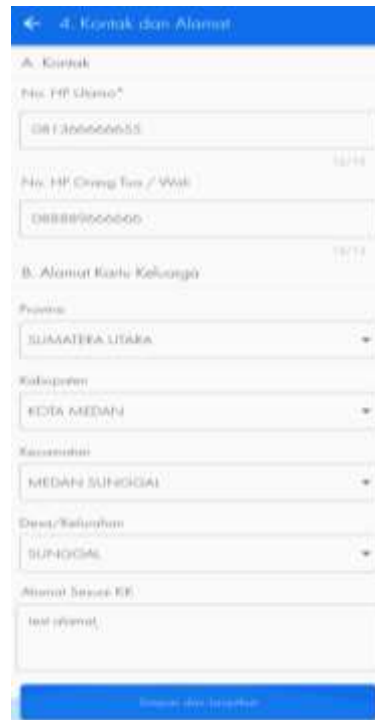
Gambar 3.7. Pemilihan Sekolah