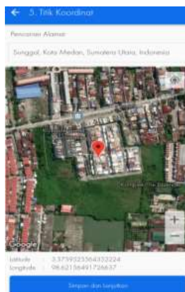
Gambar 3.8. Halaman Titik Koordinat