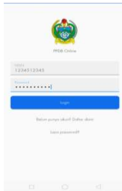
Gambar 3.2. Halaman Login