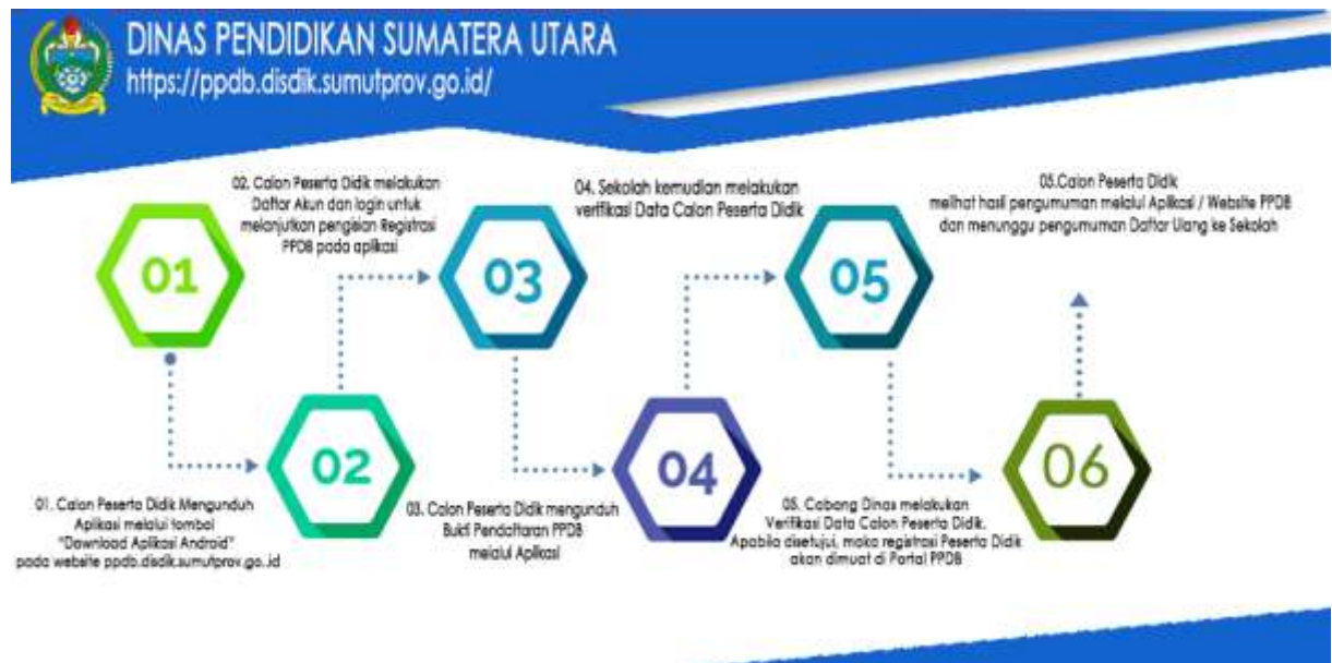
Gambar 2.1. Alur Pendaftaran PPDB

Berikut ini adalah Alur Pendaftaran Peserta Didik (PPDB) tahun ajaran 2021/2022.