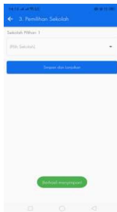
Gambar 3.6. Pemilihan Sekolah